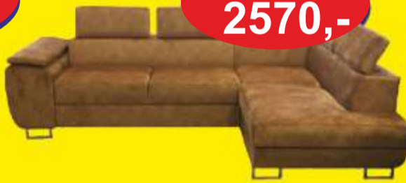
Narożnik DALLAS XXL wymiary 350 x 165 x 275 pow. spania 293 x 135