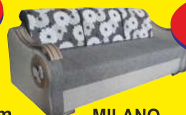
MILANO pow. spania: 190x145 cm