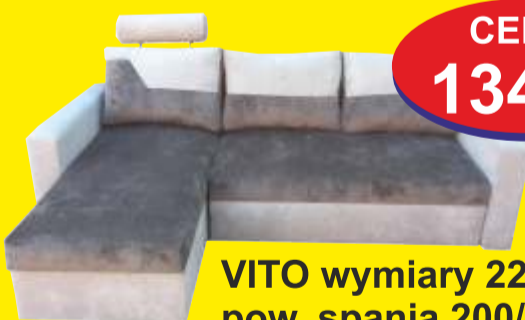
VITO wymiary 226/157cm pow. spania 200/140cm