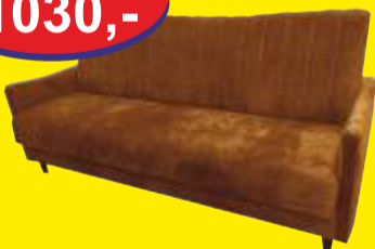
Kanapa FILIP pow. sp. 190 x 125