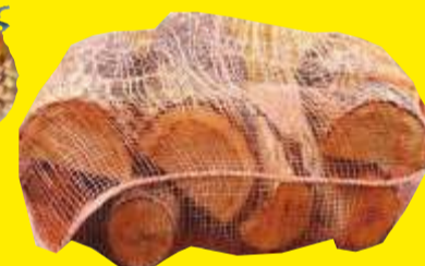
DREWNO KOMINKOWE GRUBE