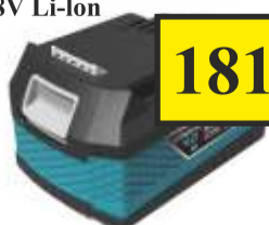
Akumulator 4.0 Ah 18V Li-Ion