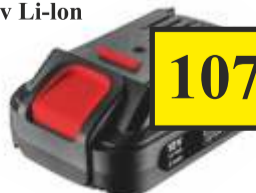
Akumulator 2.0 Ah 18V Li-Ion