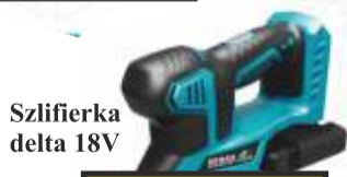
Szlifierka delta 18V