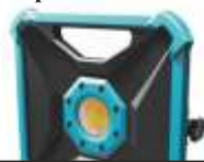
Lampa warsztatowa 18V