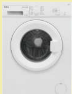
Pralka Amica NAWT6101WSW