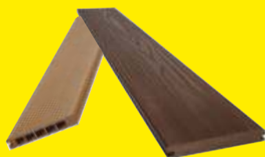
DESKI TARASOWE KOMPOZYTOWE