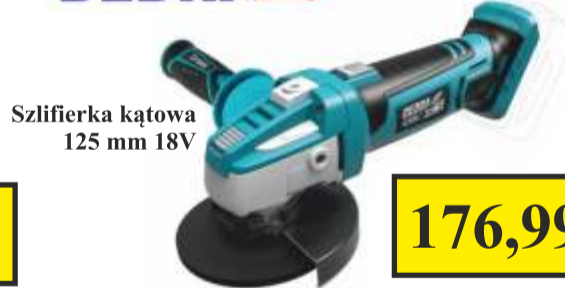
Szlifierka kątowna 125 mm 18V