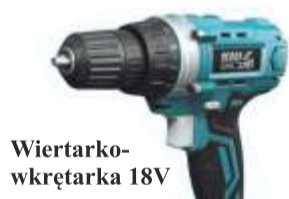
Wiertarko- wkrętarka 18V