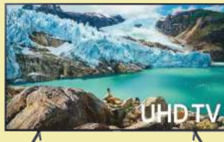
Telewizor Samsung UE50RU7172

Przekątna obrazu 32 cale Częstotliwość odświeżania 300 Hz Smart TV WiFi