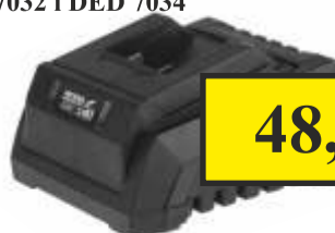
Ładowarka do DED7032 i DED 7034