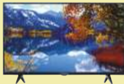
Telewizor Thomson 32HD5506

Duży wybór piekarników i sprzętu do zabudowy