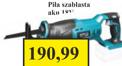
Piła szablsta aku 18V