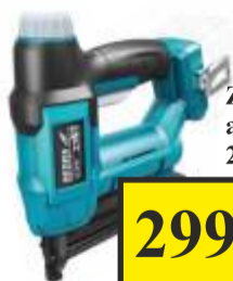
Zszywacz akumulatorowy 2 w 1