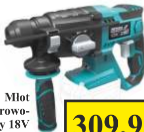
Młot udarowo- obrotowy 18V