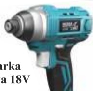
Zakrętarka udarowa 18V