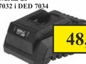
Ładowarka do DED7032 i DED 7034