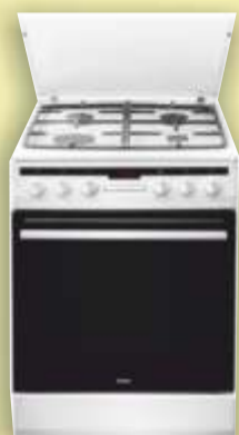
Kuchnia Amica 57GEH2.33HZpTaW

Załadunek 6 kg 1000 obr./min. Klasa energetyczna A+ Szerokość 59,7 cm