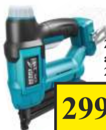
Zszywacz akumulatorowy 2 w 1