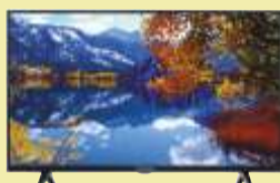
Telewizor Thomson 32HD5506

Szerokość 50 cm. Obieg gorącego powietrza Programator elektroniczny. 8 funkcji piekarnika.