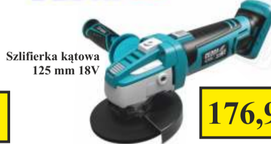
Szlifierka kątowna 125 mm 18V