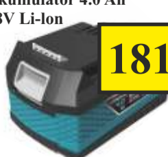
Akumulator 4.0 Ah 18V Li-Ion