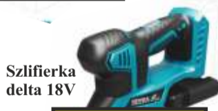
Szlifierka delta 18V