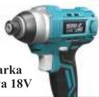
Zakrętarka udarowa 18V