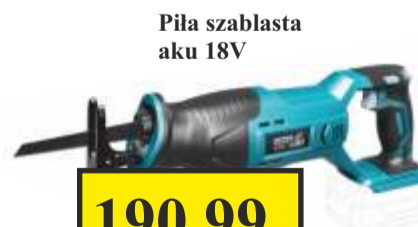
Piła szablsta aku 18V