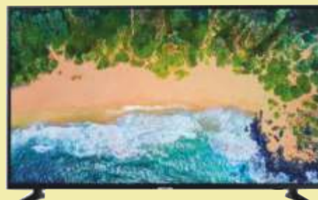
Telewizor Samsung UE55NU7093

Przekątna obrazu 32 cale Częstotliwość odświeżania 300 Hz Smart TV WiFi