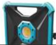
Lampa warsztatowa 18V