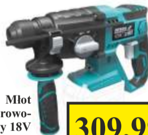
Młot udarowo-obrotowy 18V