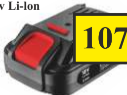
Akumulator 2.0 Ah 18v Li-Ion