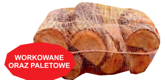
WORKOWANE ORAZ PALETOWE