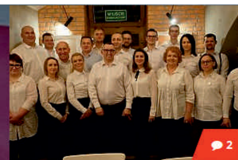
Kolejny Komitet na mapie wyborczej naszego powiatu