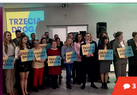
Trzecia Droga i PSL przedstawili listy. Kandydatem na burmistrza jest