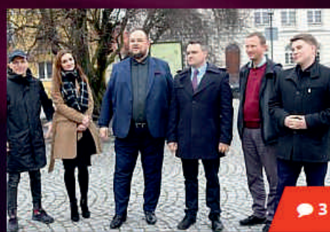
Kolejny kandydat na burmistrza Śremu przedstawia swoje propozycje