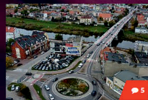
Kandydat na burmistrza Śremu chce zmierzać do budowy mostu